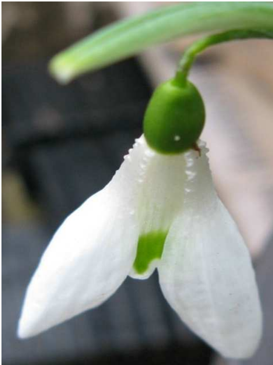
'Ballard' → Ballard