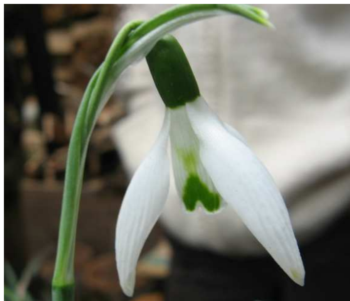
'Cedric`s Profilic' → Morris