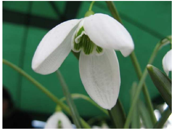
'Bill Bishop' → Mighty-Atom-Group