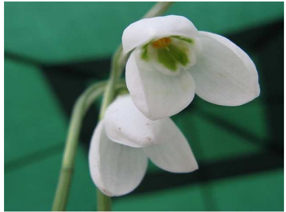
'Backhouse Spectacles' → Backhouse